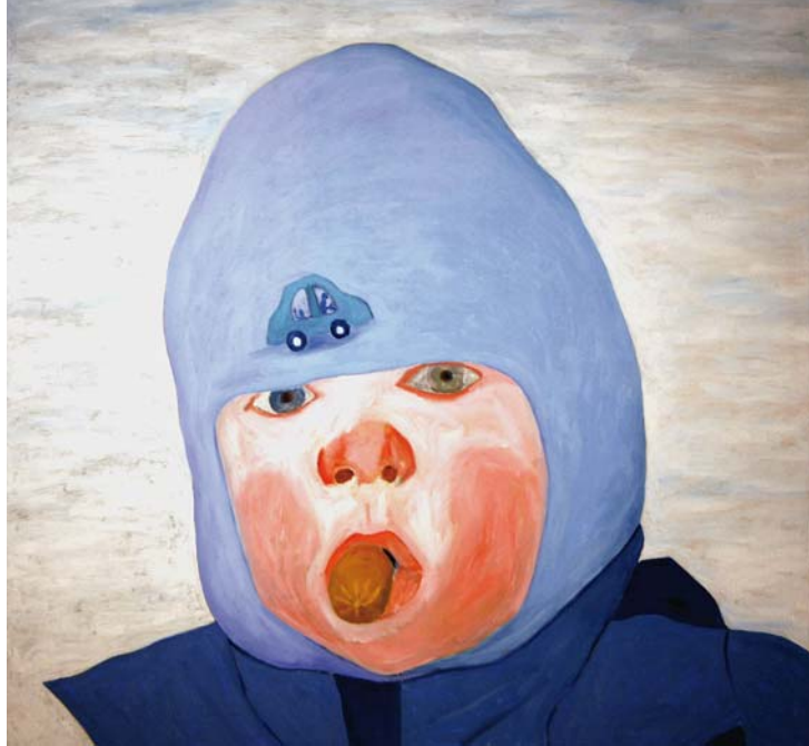
◀ Сосиска съдається , 2008, 160 x 144